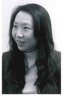
梁瑋瑩建議年幼孩子若要使用電子產品，應以學習用途為主，待他年紀大一點，才讓他用來娛樂。